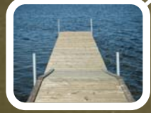
Flydebro på vandet