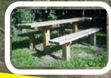
Bord-bænkesæt på p-plads