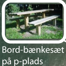
Bord-bænkesæt på p-plads