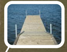
Flydebro på vandet