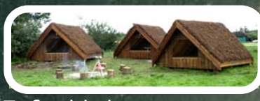
To fjordshelters med bålplads