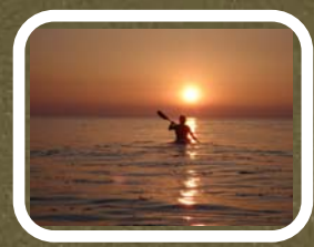
Havkajak på søen